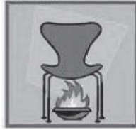
'ஹாட்' இருக்கை (HOT SEAT)