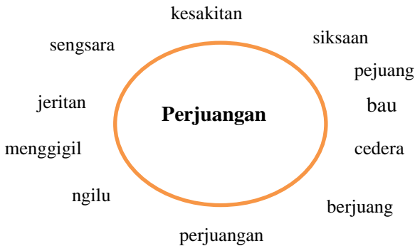
Rajah 1: Kata kunci berdasarkan konsep perjuangan

Kata kunci yang digunakan dalam petikan boleh dilihat dalam Rajah 1 di bawah ini: