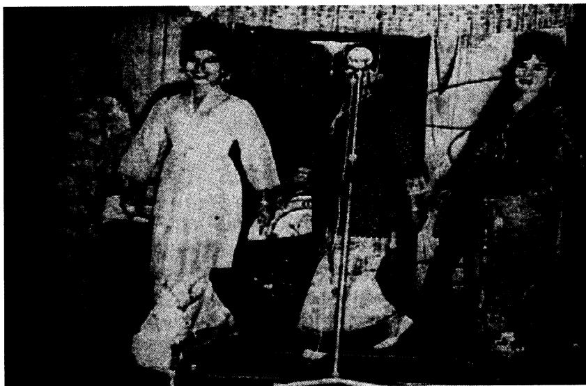
Gambar 4: Memaparkan gaya persembahan Bangsawan yang menggunakan segala kemudahan yang ada dalam melangsungkan kreativiti persembahan

Oleh itu, Bangsawan sekali lagi perlu bangkit seiring dengan selera masyarakat masa kini yang lebih terdedah dengan gaya seni persembahan yang sentiasa menjanjikan unsur-unsur spectacular , seperti yang sentiasa berlaku dalam sejarah Bangsawan yang selalu menjanjikan pembaharuan dan perubahan dalam corak persembahannya. Melalui penyerapan gaya cita rasa masa kini dengan ilmu seni persembahan pentas yang berteknologi tinggi, memungkinkan penerokaan, perkembangan, dan pembangunan kreatif dalam persembahan Bangsawan . Hal ini juga disebabkan sifat dan gaya Bangsawan yang telah menyediakan ruang dan landasan yang sangat fleksibel untuk melakukan kerja-kerja penerokaan yang kreatif. Apabila menyentuh soal penerokaan kreatif ini, akan mengundang dan membabitkan pula persoalan-persoalan seperti; bagaimanakah caranya untuk menjamin persembahan yang beridentitikan Bangsawan yang tulen? Melihatkan sifat gaya persembahan melalui bahasa penggarapan yang berfungsi sebagai ejen ketulenan, Bangsawan memerlukan cara pembinaan kreatif yang positif bagi menghasilkan persembahan yang setanding dengan persembahan yang lain tanpa meninggalkan keasliannya seperti yang dapat dilihat pada Gambar 4. Adakah gambaran sebegini yang dikatakan ketulenan?