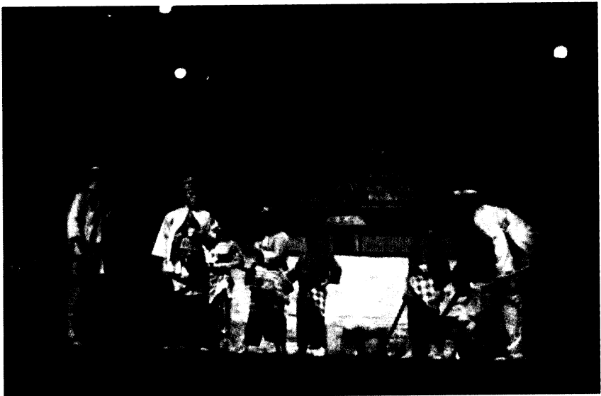
Gambar 2: Memaparkan skim warna busana yang menampakkan corak fesyen yang disesuaikan dengan warna dalam set dan ruang lakon.