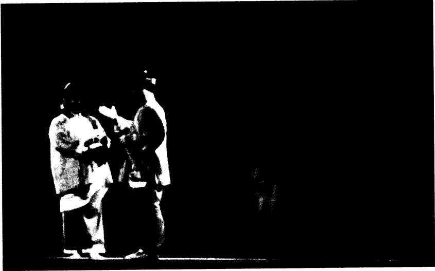
Gambar 3: Memaparkan kesan melalui tirai telus yang memberikan maksud simbol dua ruang yang membawa motif yang kontra antara watak protagonis dan antagonis.

Plot penceritaan yang terbentuk hasil dari pembentukan babak ke babak amat membantu penglihatan penonton supaya sentiasa terpandu dan juga dapat memandu para pelakon mengingati kisah cerita berdasarkan set dan latar yang disediakan. Struktur rangka kerja persembahan melalui penggunaan tirai utama, tirai perjalanan, tirai latar babak, dan tirai tebuk sebagai “bahasa penggarapan” melalui latar tempat/ruang cerita, telah menghasilkan satu gaya kesenian baru bagi kegiatan seni persembahan di Tanah Melayu ketika ini. Sebaliknya pula teater tradisional yang lain seperti Mak Yong atau Menora , mahupun Mek Mulung tidak perlu mempunyai tirai latar sama sekali. Struktur penukaran tirai latar tempat/ruang telah menjadikan peningkatan dan perubahan jalan cerita diikuti dengan lebih mudah dan menarik untuk ditonton. Keronokan dan keindahan dengan gaya teknik baru dalam pemaparan latar pemandangan tempat cerita ini, dikembangkan pula dengan kesan-kesan dari iringan muzik, dapat menambahkan lagi pengalaman keindahan serta dinamika persembahan; di samping berfungsi sebagai penanda bagi fokus setiap perubahan babak dan emosi pelakon agar tidak terlepas dari perhatian penonton – efek-efek bunyi